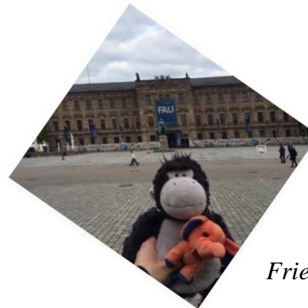
Vor dem Hauptgebäude der Friedrich-Alexander-Universität (FAU)