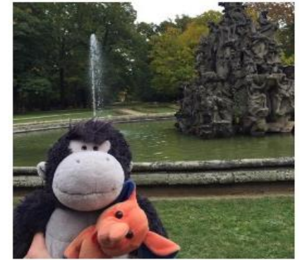
Im Schlosspark vor dem Hugenottenbrunnen

Ich hoffe, dass ich Frau Liebtier durch meine „Kuscheltier-Tour“ durch Erlangen in dieser schwierigen Corona-Zeit etwas Abwechslung bereiten konnte!