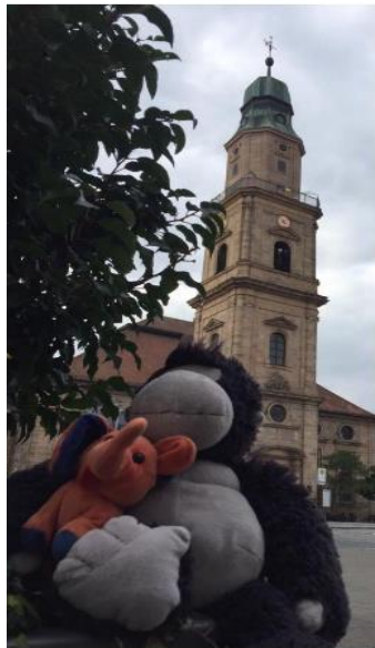
Meine Kuscheltiere vor einer schönen Kirche

In diesem Zusammenhang erfuhr ich, dass eine meiner